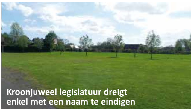
Kroonjuweel legislatuur dreigt enkel met een naam te eindigen

In juni 2014 kwam een eerste nota van het College over het Administratief en Cultureel Centrum op de gemeenteraad en mochten de fracties vragen stellen. Dat leverde heel wat opmerkingen op die nauwelijks invloed hadden op de nota die naar de adviesraden ging en die stelden meteen vooral dezelfde vragen. We spreken voorjaar 2015.